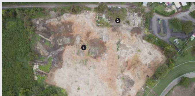
Vue zénithale du site de fouille, en bordure de l'hippodrome, en Guadeloupe. On distingue ❶ les bâtiments industriels et ❷ le quartier d'esclaves.

Sur ces terres, l'hippodrome de Guadeloupe dessine une grande forme oblongue, mais il n'en a pas toujours été ainsi. En fouillant les abords de la piste, les archéologues ont retrouvé les traces d'une purgerie, d'une sucrerie et de multiples rangées de cases rectangulaires formant un quartier d'esclaves. Une habitation-sucrerie se trouvait donc ici. Ce genre de domaine comprenait plantations, ateliers de transformation, rues « cases-nègres » et maison du maître. Il permettait au colon d'exercer un contrôle permanent sur ses esclaves. Produit ainsi à moindre coût, le sucre était vendu fort cher en métropole. En 1830, à l'apogée du système des habitations-sucreries, la Guadeloupe en comptait plus de 600, qui employaient près de 90 000 esclaves.