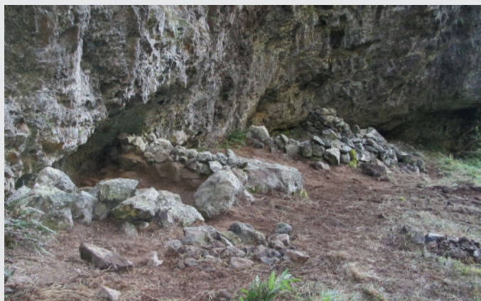
Structures en pierres sèches, vestiges de deux abris découverts dans une petite vallée du cirque de Cilaos à La Réunion ; le site a été fouillé en 2011 et en 2012.

Très montagneux, l'intérieur de l'île de La Réunion était un terrain propice pour les « marrons », ces esclaves qui refusaient de l'être et préféraient la fuite. En 1995, à 2 000 mètres, un guide de montagne a trouvé au fond d'une petite vallée encaissée les vestiges de deux abris. À une telle altitude, ce site accessible uniquement en rappel pouvait-il être lié au marronnage ? Une fouille archéologique l'a confirmé. Occupé au début du XIX e siècle, ce refuge secret servait aussi de halte de chasse : une parfaite connaissance de l'île permettait aux marrons d'échapper à la traque incessante des « chasseurs de nègres » en vivant de chasse et de cueillette.