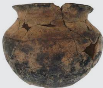
Marmite de tradition africaine en terre cuite, après recollage. Elle a été découverte lors de la fouille d'une habitation-sucrerie à Saint-Claude en Guadeloupe.

Elle a fini à la poubelle, cette marmite. Et c'est dans la fosse où on l'avait jetée, sur le site d'une ancienne habitation-sucrerie de Guadeloupe, qu'un archéologue l'a retrouvée. Pourquoi s'intéresser à cette modeste poterie ? C'est qu'elle n'a rien d'européen ni d'amérindien, et qu'elle ressemble indéniablement par sa forme et son mode de fabrication aux poteries d'Afrique de l'Ouest. Rarement mentionné dans les archives, ce genre d'objet était certainement fabriqué par les esclaves pour eux-mêmes, selon des savoir-faire traditionnels. Une production discrète côtoyait donc la masse des céramiques que les esclaves fabriquaient utilisant des techniques européennes pour la production industrielle du sucre.