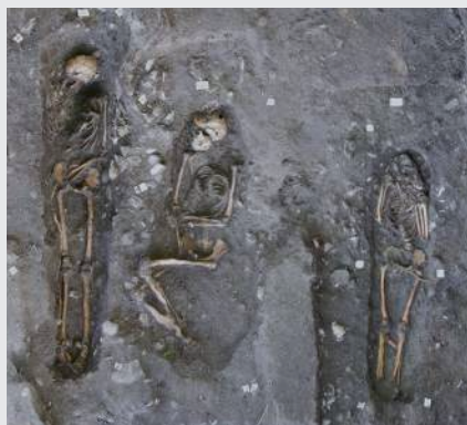
Les sépultures 53, 48 et 51 (de gauche à droite) découvertes à l'Anse Bellay. L'individu de la sépulture 51 présente des incisives supérieures taillées en pointe, pratique initiatique africaine.

Tout concourt donc à identifier le site comme un cimetière d'esclaves. Sur cette bande de terre littorale, des hommes et des femmes se sont emparés de la religion imposée par leurs maîtres pour offrir des funérailles à leurs proches.