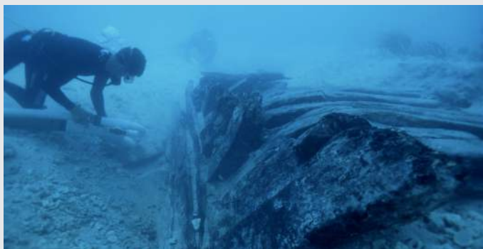
Fouille sous-marine autour de l'épave de l' Henrietta Marie , naufragée en 1700 au large de la Floride.

C'était un navire négrier ordinaire. Chargé de vaisselle en étain et de perles de verre, l' Henrietta Marie quitte Londres en septembre 1699. Sur les côtes d'Afrique occidentale, l'équipage troque sa cargaison contre de l'ivoire et plus de deux cents captifs – hommes, femmes et enfants. Puis le bateau reprend le large, direction la Jamaïque. C'est là, après deux mois de traversée enchaînés dans les cales, que les esclaves sont vendus. On charge alors du sucre, du coton, de l'indigo et du bois à revendre en Europe. Mais le navire sombre sur le chemin du retour, en mai 1700, emportant les espoirs de fortune de ses armateurs. Les vestiges archéologiques de cette folie commerciale ont été découverts sous les flots, au large de la Floride.