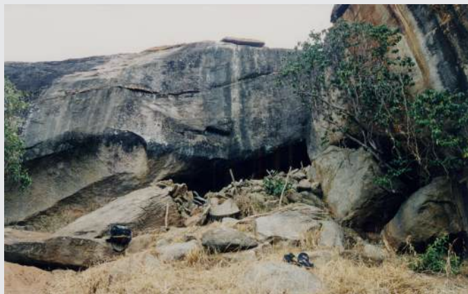
L'un des abris-sous-roche fortifiés utilisés pour échapper à la traite et aux violences, découvert sur le mont Kasigau au Kenya.

Il en a fallu des efforts, pour monter pierre à pierre des murets aussi épais, dans des endroits aussi inaccessibles. Sur le mont Kasigau, au sud du Kenya, ont été découverts les vestiges d'une trentaine d'abris naturels fortifiés. Ils servaient de refuges temporaires, où l'on se repliait en cas d'alerte. Nichés en pied de falaises, ils se fondaient dans le paysage, permettant d'observer discrètement les alentours à des kilomètres à la ronde. De quelle terrible menace fallait-il ainsi se protéger? Au moment de l'utilisation de ces abris de montagne, entre le XVIII e et le XIX e siècle, les razzias d'hommes se multipliaient. Sur la côte, la traite négrière battait son plein.