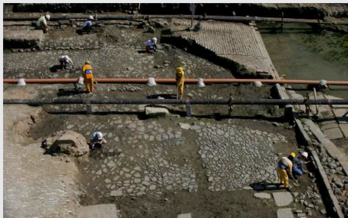
Fouille du quai de Valongo, réalisée à Rio de Janeiro au Brésil en 2011. On y reconnaît les deux strates de chaussée successives.

À l'occasion du réaménagement de la zone portuaire de Rio de Janeiro, avant les JO de 2016, une fouille a révélé au grand jour tout un pan du passé de la ville. Sous le bitume carioca, les archéologues ont dégagé les vestiges de deux quais superposés. Construit en 1811, le plus ancien et le plus vaste, appelé quai de Valongo, était destiné aux bateaux négriers. Pendant trois décennies, quelque 900 000 Africains y ont transité contre leur gré. Puis, en 1843, le débarcadère aux esclaves a été remblayé et recouvert d'un quai flambant neuf, digne de recevoir l'impératrice Thérèse-Christine de Bourbon-Siciles, venue épouser l'empereur Pierre II.