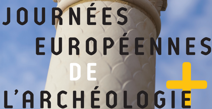
Conception : D.Cam GJ80 - Impression : Imp. CJB80