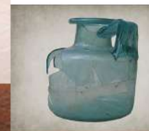
Urne funéraire en verre Pulvérières