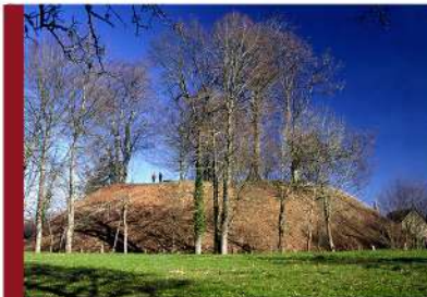
HALTE 5 - MOTTE CASTRALE (Giat)