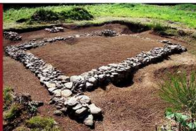
HALTE 3 - SITE GALLO ROMAIN DE BEAUCLAIR (Giat et Voingt)