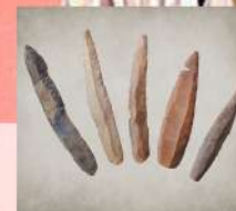
Poignards en silex Saint-Étienne-des-Champs