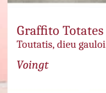
Graffito Totates Toutatis, dieu gaulois Voingt