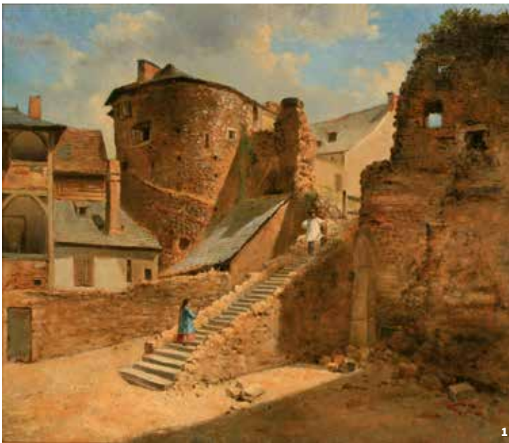
1. Georges Crinier - L'enceinte romaine avant la construction du tunnel - 1869 - Musées du Mans 2. Vindinum , ville ouverte avant la construction de l'enceinte romaine - Dessin Pierre Poulain