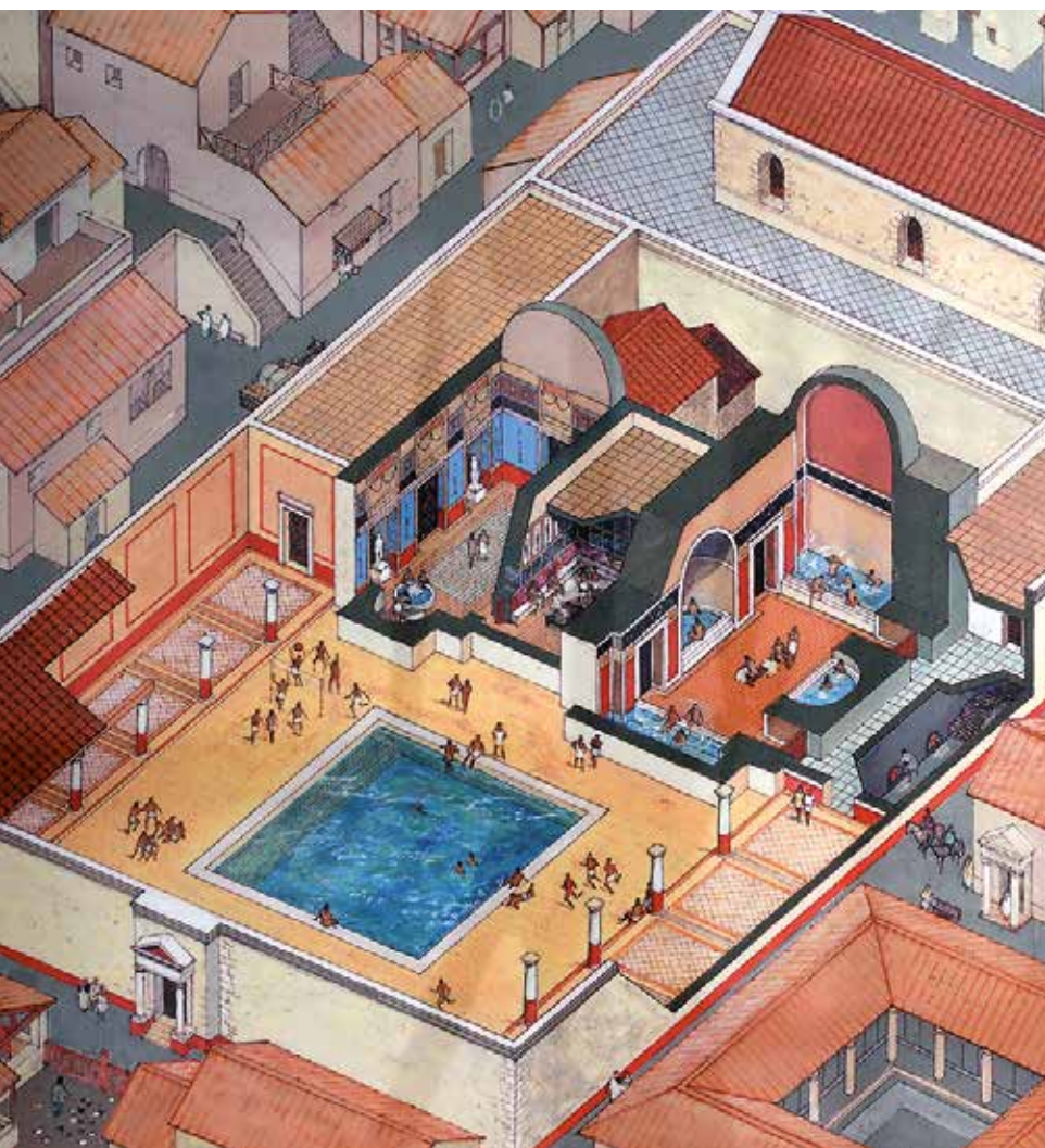
Illustration des thermes de Vindinum par Pierre Poulain.